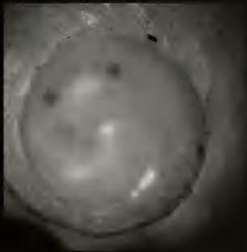
Lámina 2.- Figuras 8-13. Cancellaria pusilla H. Adams, 1869. 8: dibujo de la descripción original; 9: texto de la descripción original; 10-11: sintipo en BMNH; 12: detalle de la abertura; 13: protoconcha.